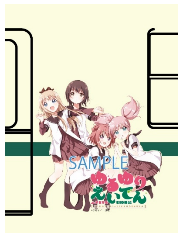
コラボラッピングのイメージ