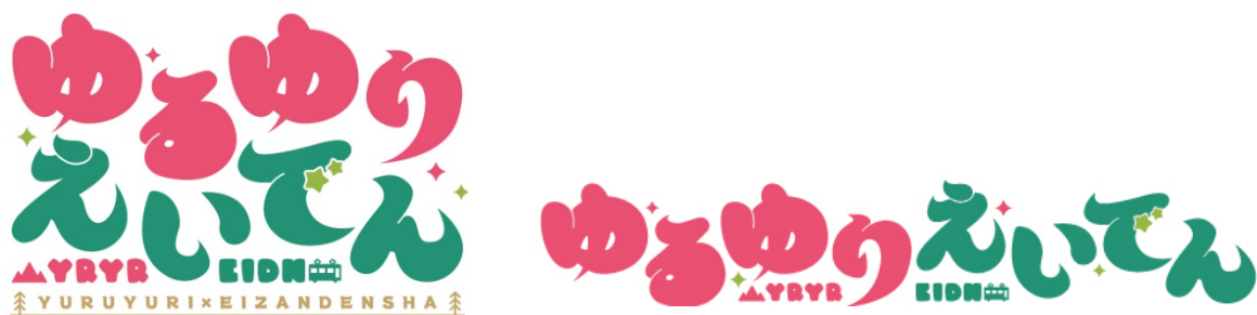
コラボロゴのイメージ