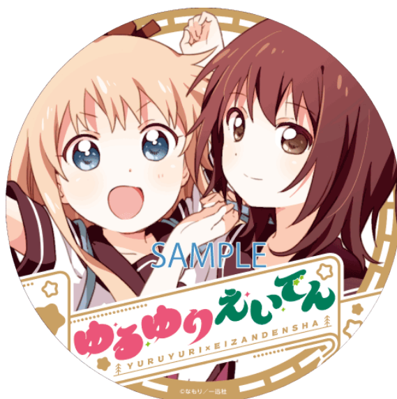
ヘッドマークのイメージ