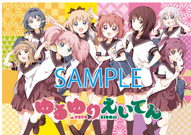
コラボきっぷ特典台紙のイメージ

※2020年7月8日（水）の大雨により貴船口駅付近で発生しました土砂災害で、鞍馬線市原駅から鞍馬駅間が運休となり、復旧の見通しが立っていないこと、京都府が独自に設けた新型コロナウイルスに関する基準が、7月14日（火）に「警戒基準」に達し、お客さま・関係者への感染拡大防止・安全確保を最優先とすることを考慮した結果、「えいでん×ゆるゆり コラボフェスタ」の中止を決定いたしました。なお、従来お知らせしておりました内容から一部変更がございますので、別紙をご覧ください。（2020年7月15日追記）