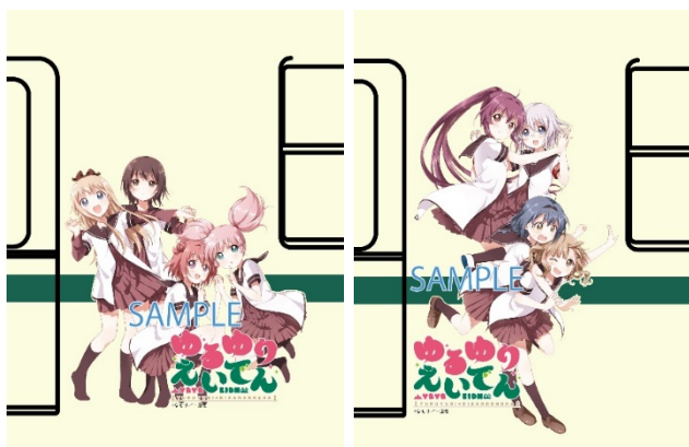
車体ラッピングのイメージ

※運転時間は日によって異なります。また、車両点検やその他の理由により運休や運行期間を変更することがありますのであらかじめご了承ください。