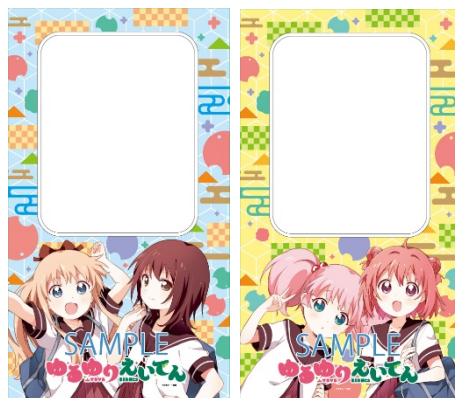
車内(ドア)ラッピングのイメージ