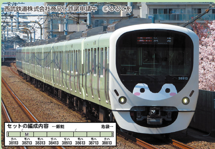
西武鉄道株式会社商品化許諾申請中 ©るるであ