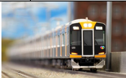
写真は前回製品です。