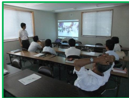
・第三者暴力行為災害の対処事例