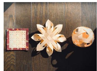
【きおび完成イメージ】