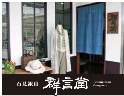
石見銀山 群言堂 Iwamiganzan Gunjido

世界遺産の島根県石見銀山で、古き良きものに新たな価値を創造する「復古創新」によって、婦人服や雑貨、化粧品などのものづくりに取組み、「根のある暮らしを楽しむライフスタイル」を提案するブランド「群言堂」の直営店。