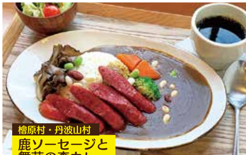
檜原村・丹波山村 鹿ソーセージと 舞茸の森カレー