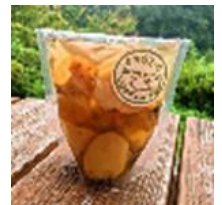
【オオカミ印のピクルス】