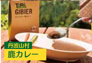
丹波山村 鹿カレー