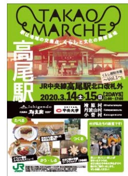
【ポスターイメージ】