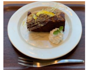
【ビターチョコレート柚子ケーキ】