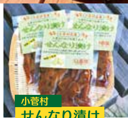
小菅村 せんなり漬け