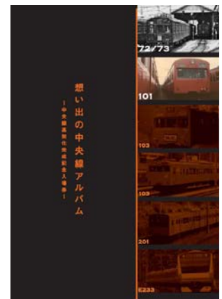
「思い出の中央線アルバム」 （イメージ）

3. 発売箇所 武蔵境駅、東小金井駅、武蔵小金井駅、国分寺駅、西国分寺駅、国立駅の6駅