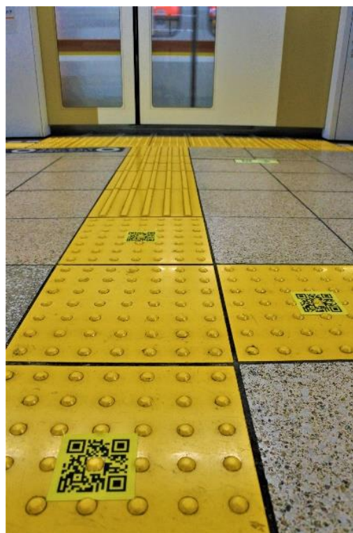
QRコード設置イメージ