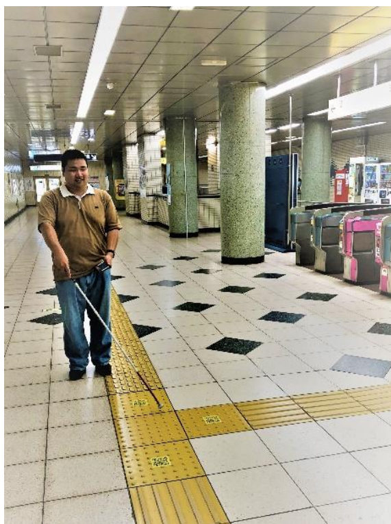
実証実験イメージ