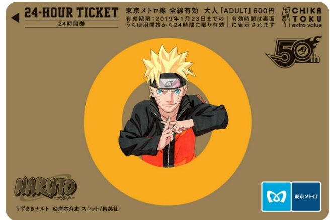
NARUTO ©岸本斉史 スコット/集英社