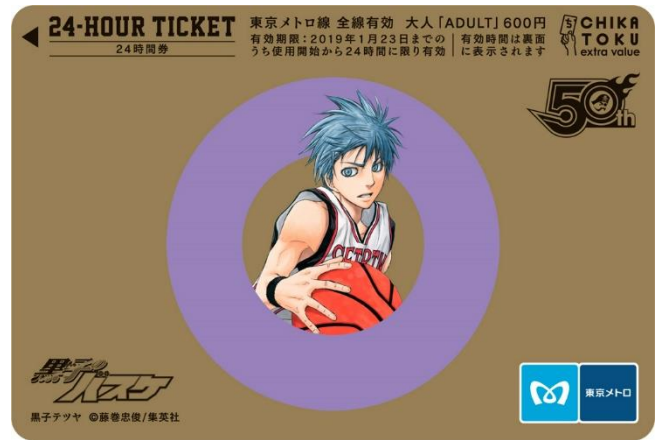
黒子のバスケ ©藤巻忠俊/集英社