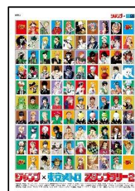
オリジナルステッカー