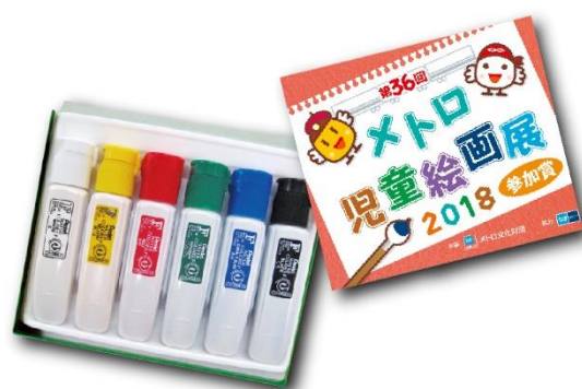
参加賞（オリジナル絵の具）