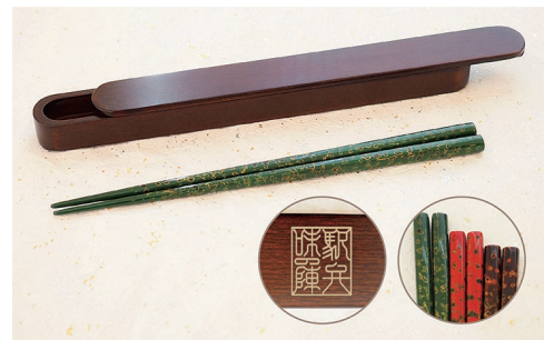
津軽塗 箸 (木製ケース付き)