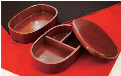
会津塗 ケヤキお弁当箱 (風呂敷付き)

*JRE MALL は、鉄道グッズや Suica のペンギングッズはもちろん、日用品のお買い物もできるショッピングサイトです。