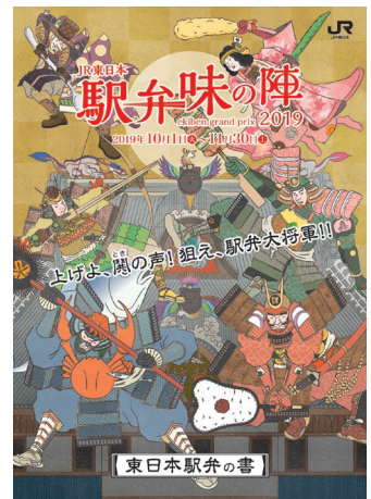
メインビジュアル