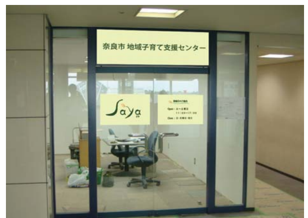
奈良市地域子育て支援センター「Saya（さや）」