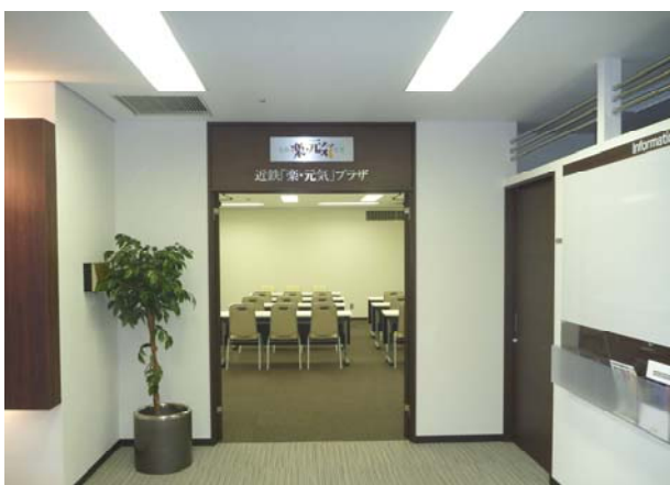
近鉄「楽・元気」プラザ

「近鉄“楽・元気”生活」では、近鉄沿線にお住まいの皆様の「暮らしのコンシェルジュ」として、各種イベントやセミナーの開催のほか、幅広い世代の方々にお喜びいただけるサービスをご提供していきたいと考えています。近鉄「楽・元気」プラザならびに「奈良市地域子育て支援センター」についての詳細は別紙のとおりです。