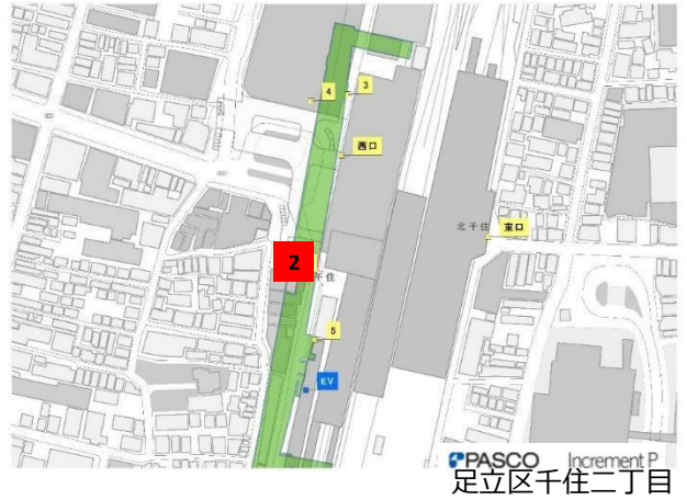
千代田線 北千住駅