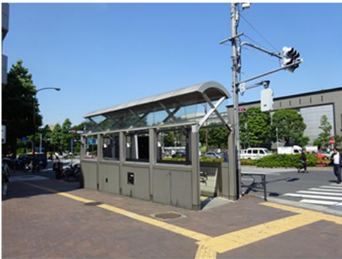
四ツ谷駅 2番出入口付近

「えき・まち連携プロジェクト」の詳細は別紙のとおりです。皆様のご提案をお待ちしております。