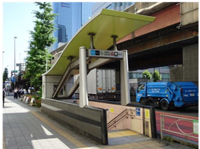
仲御徒町駅 4番出入口付近