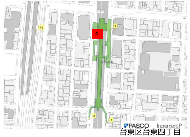
日比谷線 仲御徒町駅