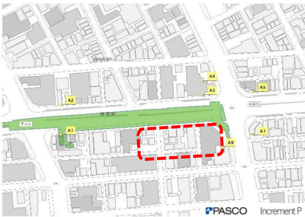
半蔵門線 神保町駅