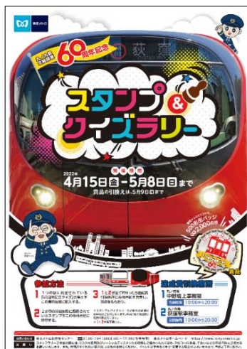
スタンプ台紙イメージ

1954 年（昭和 29 年）1 月 20 日に丸ノ内線池袋駅～御茶ノ水駅間が開業しました。その後、順次延伸開業し、1959 年（昭和 34 年）3 月 15 日に霞ヶ関駅～新宿駅間が開業したことで、当時の丸ノ内線が全線開業となりました。新宿以西の荻窪線は 1961 年（昭和 36 年）2 月 8 日に新宿駅～新中野駅間が開業。その後順次延伸開業し、1962 年（昭和 37 年）3 月 23 日に中野富士見町駅～方南町駅間が開業したことで、荻窪線が全線開業となり、現在の丸ノ内線が完成しました。1972 年には荻窪線の名称を廃止し、全線「丸ノ内線」に統一しました。多くのお客様にご利用いただき親しまれてきた丸ノ内線は、1962 年の荻窪線全線開業から今年で 60 周年を迎えました。