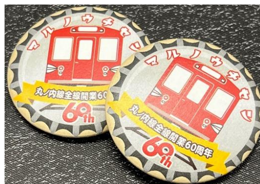
達成賞イメージ（サイズ：約3.5cmΦ）