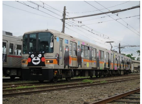
【熊本電鉄 01 形くまモンラッピング電車】

2016 年 6 月 11 日（土）からは熊本電鉄 01 形くまモンラッピング電車としてたくさんの方にご乗車いただき、北熊本駅から上熊本駅まで熊本復興に繋がればという想いを乗せ運行しています。