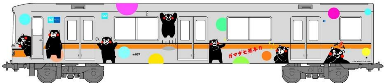
銀座線くまモンラッピング電車イメージ