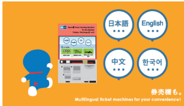
<ポスターイメージ>