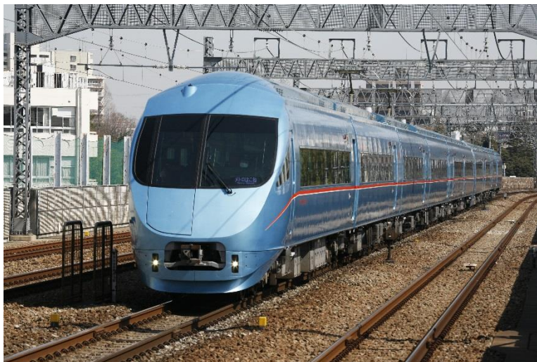
「メトロおさんぼ号」に使用するロマンスカー・MSE（6000形）