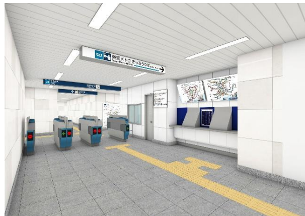
新設した中央改札（イメージ）