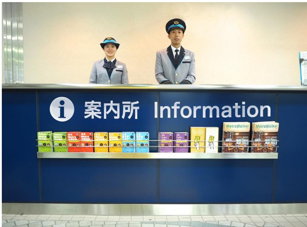
池袋駅旅客案内所（写真イメージ）