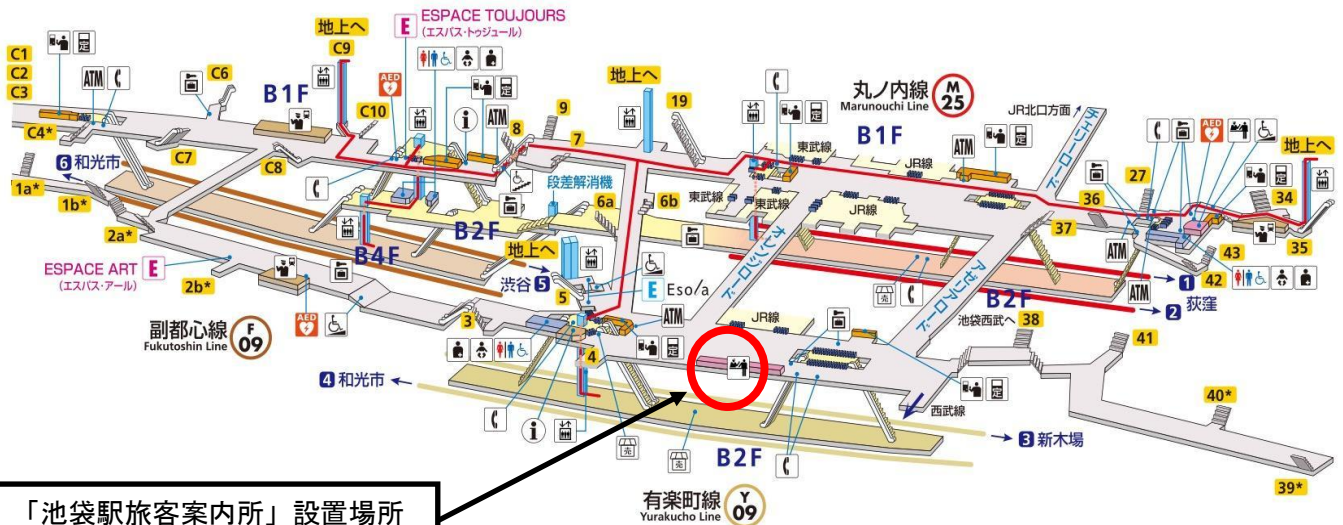
池袋駅構内立体図