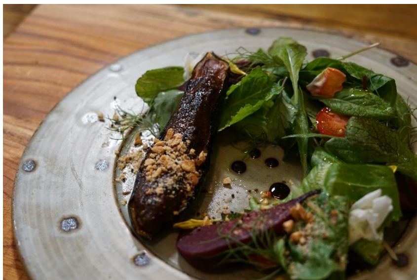
「秋茄子の江戸甘味噌田楽サラダ」イメージ