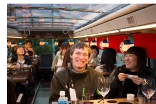
レストランバス車内イメージ