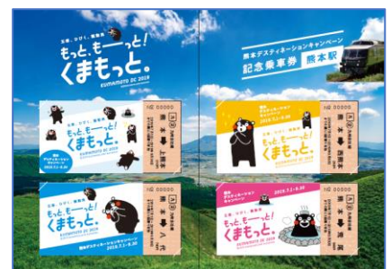
中面デザインイメージ