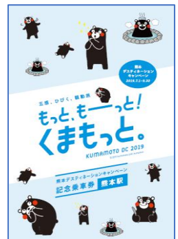
表紙デザインイメージ