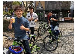
たベコギのイメージ