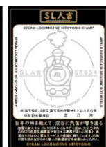
特別記念乗車証イメージ