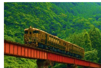
「或る列車」運行イメージ

熊本DC期間中、豪華スイーツコースで大人気の「JRKYUSHU SWEET TRAIN『或る列車』」が、豊肥本線大分駅～阿蘇駅間を特別運行します。