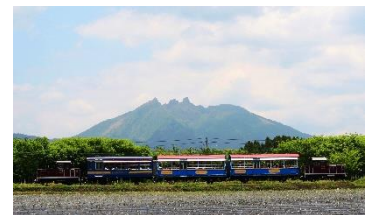
南阿蘇鉄道「ゆうすげ号」

○設定期間：土曜、日曜、祝日及び2019年7月20日（土）から9月1日（日）の毎日