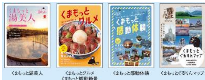
ガイドブック表紙