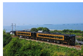
特急「A列車で行こう」