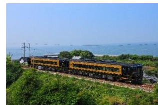
特急「A列車で行こう」