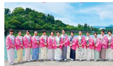
人吉温泉さくら会