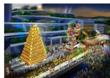
メイン会場イメージ