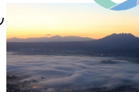
かぶと岩展望所からの景色