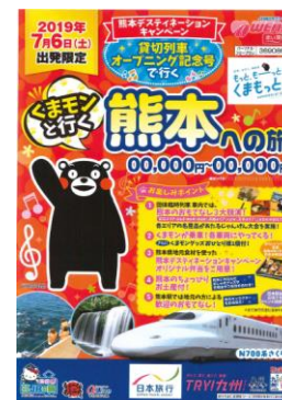
パンフレットイメージ