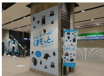
バナー・のぼり旗イメージ

熊本DCの開催期間中、熊本駅の駅コンコースなどでは、熊本DCのバナーやのぼり旗、フラッグなどを設置するほか、JR九州の主な駅ではミニのぼり旗を設置します。