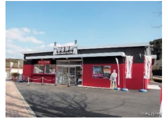
金栗四三ミュージアム