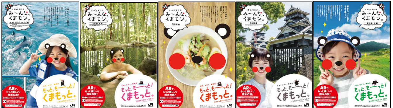
(A) 天草イルカウォッチング

熊本県が制作した5連貼りポスターを、2019年6月1日（土）～30日（日）の間、全国のＪＲ主な駅に掲出します。ＤＣガイドブックでも紹介する、スペシャルコンテンツのＡＲカメラ“ＣＯＣＯＡ Ｒ２”の活用をイメージしたポスターです。