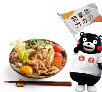
オリジナルメニューのイメージ