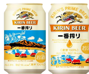
デザインイメージ