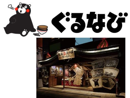
熊本火の国ワールド (協力店舗の一例)

※Instagram（インスタグラム）は、Facebook Inc. が提供している無料の写真共有アプリケーションです。