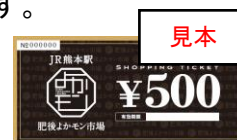
ショッピングチケット イメージ