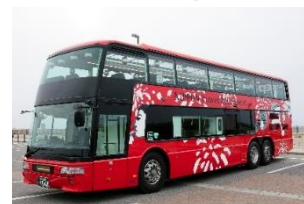
レストランバス外観