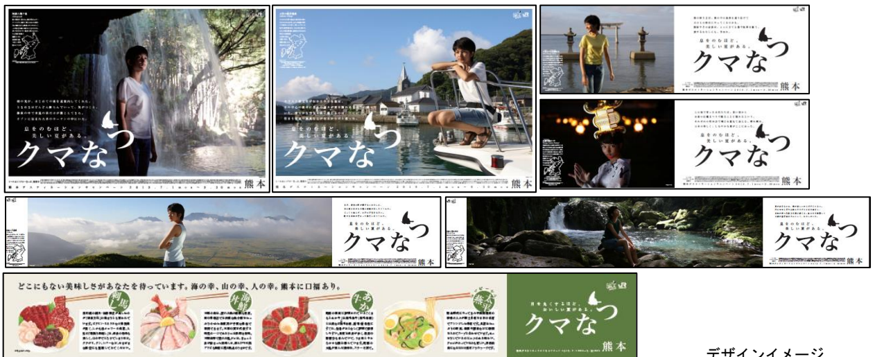
デザインイメージ

今回のポスターのタイトルは「クマなつ」です。熊本の夏を満喫するデザインとなりました。（掲出時期）2019年5月24日（金）～9月30日（月）まで全国のＪＲの主な駅・車内等に掲出。