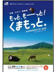
ガイドブック表紙

各エリアの観光情報やキャンペーン期間中に開催されるＤＣ特別企画、イベント情報などを掲載した熊本ＤＣガイドブック約４０万部を、全国のＪＲ主な駅や旅行会社窓口を中心に配布します。