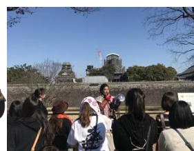
ガイドツアーのイメージ