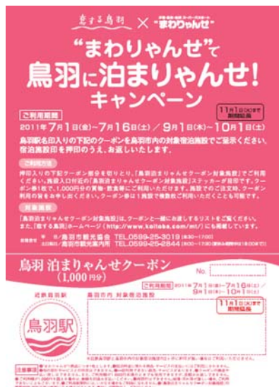
鳥羽泊まりゃんせクーポン ※イメージ

※「鳥羽駅印」「宿泊施設印(または観光協会印)」の2つのハンコが揃うと、クーポンが有効となりご利用いただけるようになります。