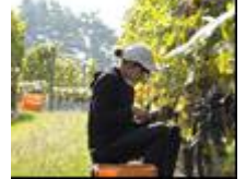
中央葡萄酒ミサワイナリー (イメージ)