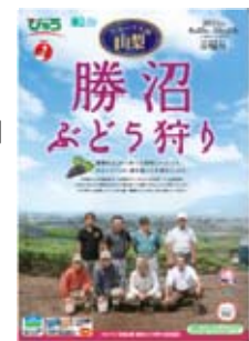
「勝沼ぶどう狩り」 パンフレット（イメージ）