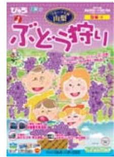
「ぶどう狩り」 パンフレット（イメージ）