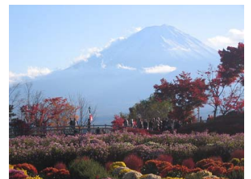
紅葉の富士山を眺める 河口湖湖畔散策(イメージ)