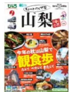
「ちょっと行く甲斐山梨」 パンフレット(イメージ)