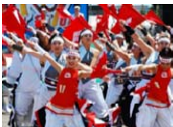
甲斐◆風林火山(イメージ)