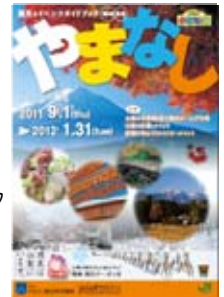
「観光&イベントガイドブック やまなし秋・冬号」(イメージ)