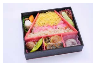
▲「駅弁 かいじ」(イメージ)