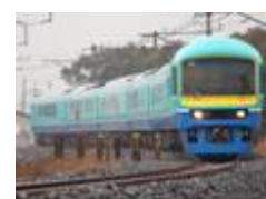
お座敷列車「ニューなのはな」