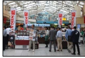
<産直市イメージ写真>