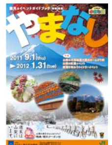
「観光&イベントガイドブック やまなし秋・冬号」(イメージ)