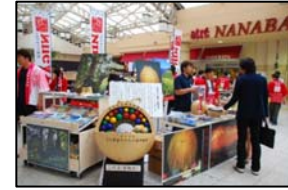
<観光PRブースイメージ写真>