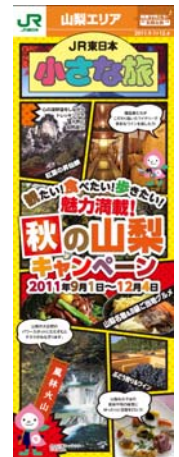
「小さな旅」(イメージ)