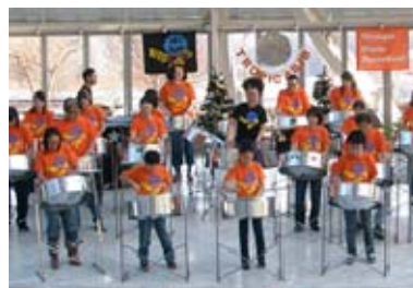
Steel Pan BAND 「珠 with Tropicarib」 (イメージ)