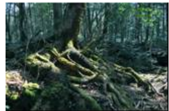
青木ヶ原樹海 (イメージ)