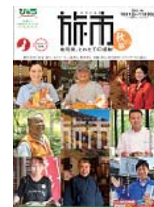
「旅市 秋の旅」 パンフレット（イメージ）