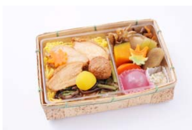
▲「甲斐の国 よっちゃばれ鶏めし弁当」 (イメージ)