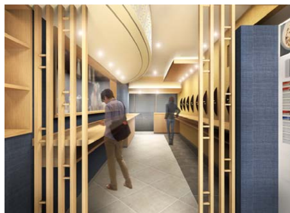
「麺ざんまい」 店内イメージパース