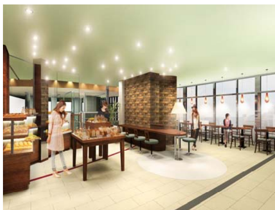
「カフェ チャオプレッソ」 店内イメージパース