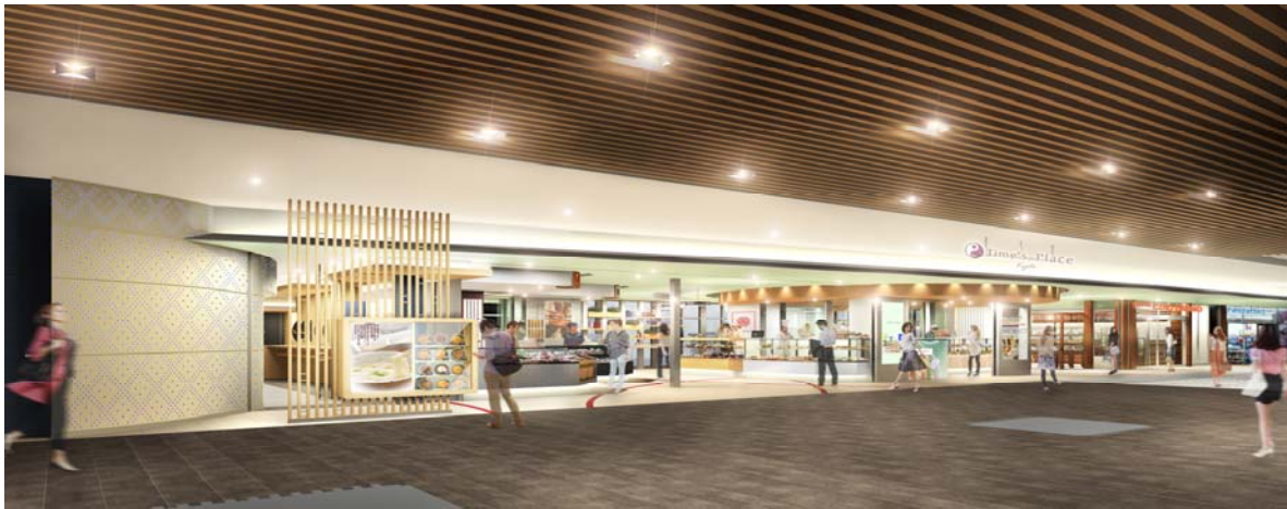
『Time's Place Kyoto』イメージパース