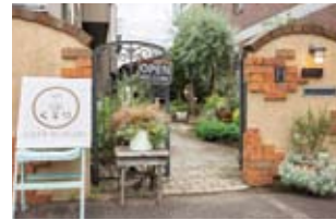
住宅街にひっそり佇む自宅カフェ。地下鉄を降りてすぐというアクセスのよさも魅力的

ミートローフとキーマカレー、サラダがワンプレートになった「スペシャルMIXランチ」(1,650円)。前菜、スープ、デザート、ドリンク付