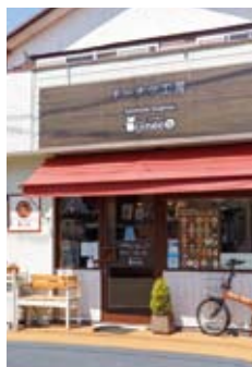
東中田の住宅街に位置。ドーナツはオンラインでも販売