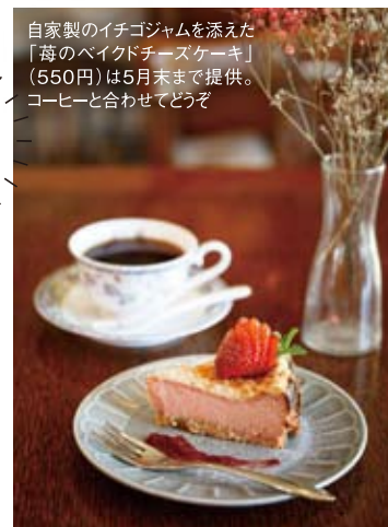
自家製のイチゴジャムを添えた「苺のベイクドチーズケーキ」(550円)は5月末まで提供。コーヒーと合わせてどうぞ

仙台市太白区諏訪町13-44 あすと浪漫座1F ☎022-746-8466 https://www.s-vintagecafe.com