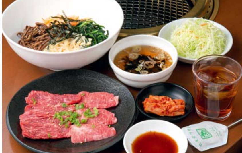
「牛カルビ定食」(1,045円。写真は+220円でビビンバに変更。昼限定)はスープ、サラダ、キムチ、ドリンク付