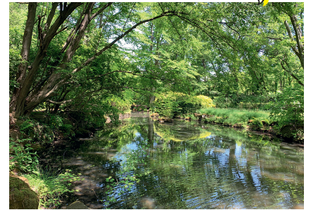
園内には日本庭園や野外音楽堂も。ランニングやウォーキングに精を出す方たちもたくさんいました