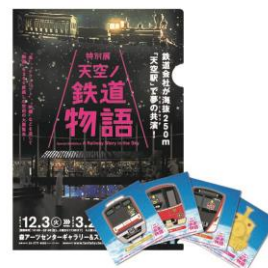
特製クリアファイルとステッカー (非売品)

賞品の引換は、達成賞、来場記念達成賞それぞれお一人様1つとさせていただきます。無くなり次第終了となります。