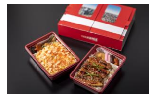
天空駅オリジナル駅弁「ドア弁」(イメージ)