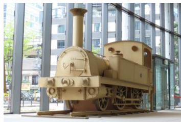
「一号機関車」(段ボール製)