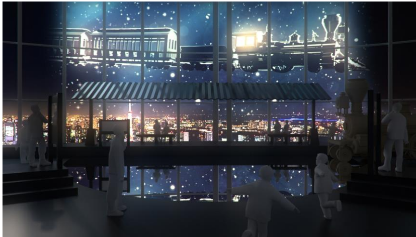
天空駅：夜(イメージ)

“食”、“テクノロジー”、“映像”などを通じて「鉄道」を 360 度楽しむ空前の大展覧会！