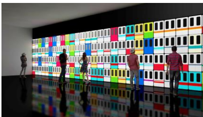
鉄道車両ドア インスタレーション (イメージ)

JR7 社、東京メトロ、東京都交通局をはじめ、全国の鉄道会社の全面協力のもと、全国の鉄道系博物館でも通常は観ることができない蔵出しの展示品を軸に、国鉄時代の駅や改札の再現、歴史を振り返る空間やインスタレーション、ヘッドマークや時刻表、制服も展示し、1964 年から 2020 年のオリンピックイヤーを結ぶ形で鉄道文化の軌跡を紹介します。日本独自の鉄道文化ゆかりの「食」「旅」「アニメーション」「ゲーム」「テクノロジー」などもフィーチャーし、鉄道ファンはもちろん、子どもから大人まで楽しめる体感型 の展覧会です。