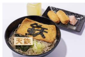
天空駅そば(イメージ)