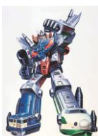
トランスフォーマー