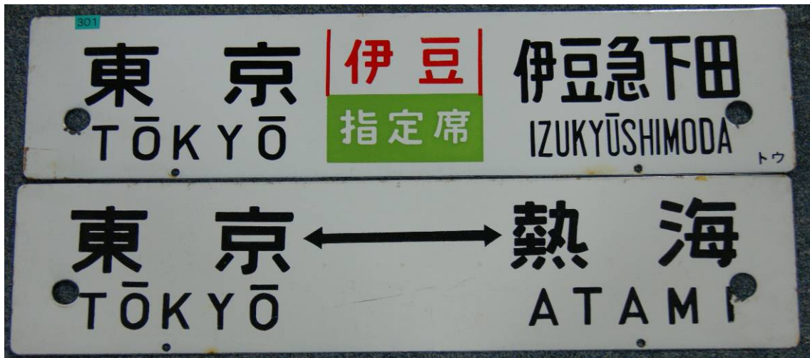
【鉄道部品（行先票：サボ）イメージ図】