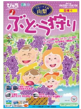
パンフレットの表紙 (イメージ)

今年は、もも狩りでご好評いただいている「金桜園コース」・「見晴し園コース」 をぶどう狩りでも設定しました。