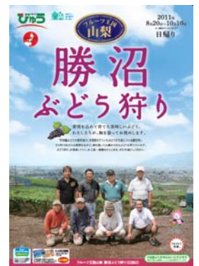
パンフレットの表紙 (イメージ)