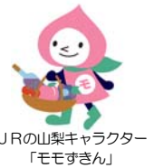
JRの山梨キャラクター 「ももすきん」

JR東日本では、8月～10月の「ぶどう狩り」をテーマにしたびゅう旅行商品『フルーツ王国 山梨「勝沼ぶどう狩り」「ぶどう狩り」』を発売します。毎年ご好評をいただいているぶどう狩りと温泉入浴などをセットにしたコースの他、今年は「もも狩り」でご好評をいただいている「金桜園コース」・「見晴し園コース」を「ぶどう狩り」でも設定しました。また、“本当に伝えたい山梨の魅力”<山梨プレミアム>と題したこだわりの旅も継続して設定しています。趣向を凝らした多数のコースをご用意していますので、ぜひ、ファミリー、グループ、カップルでぶどうの甘い匂いの味覚を心ゆくまでお楽しみください！