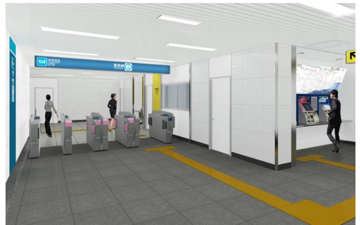
新設改札口イメージ