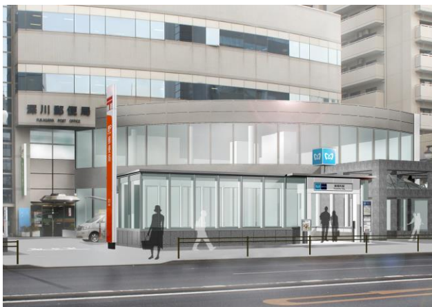
新設出入口イメージ