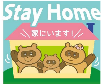
LINEスタンプイメージ (メトポン/ポン太/チカポン)

※「メトポンファミリー」は、「メトポン(父)」、「チカポン(母)」、「ポン太(息子)」の3人家族です。