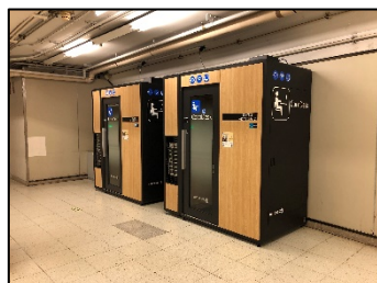
日比谷線 霞ヶ関駅