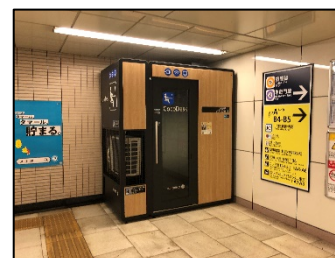
半蔵門線 三越前駅