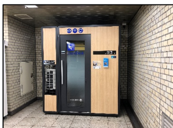
半蔵門線 半蔵門駅