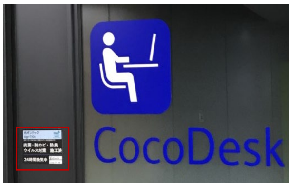
抗菌コーティングを完了したブース