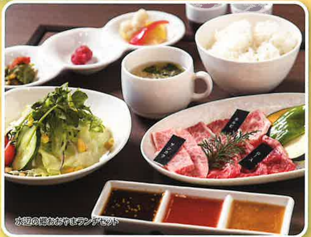
水辺の郷おおやまランチセット