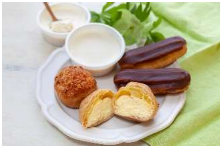
商品イメージ (スイーツ)

シュークリームは、バニラビーンズがクリームに風味豊かさをくわえ、エクレアは口どけなめらかなチョコレートでコーティング、バイクドレアチーズケーキは低温でじっくり焼きあげた、なめらかで濃厚な味わいです。