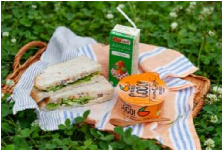
商品イメージ (ヴィーガンランチ)

近年、日本でも植物性の原料をつかった商品が人気です。バイオセボンでも、ヴィーガンの方が安心して食事を楽しんでいただける商品を取り揃えました。