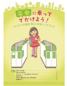
ハンドブックイメージ