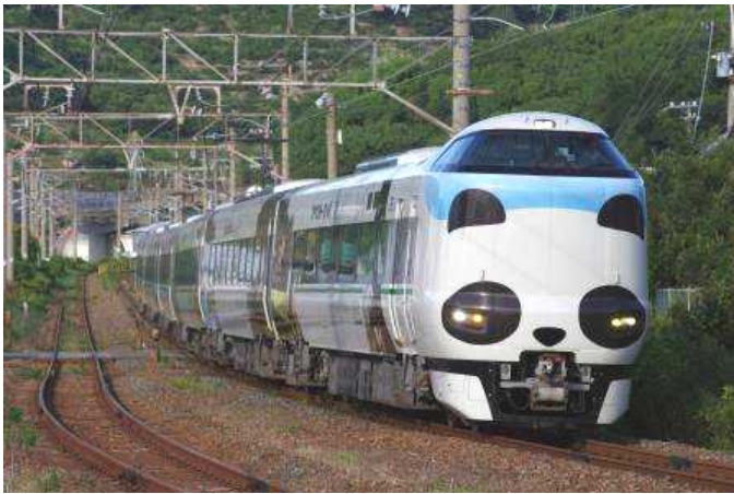
パンダくろしお『Smileアドベンチャートレイン』

臨時列車の2号車・3号車は自由席です。 列車遅延・自然災害・車両点検・その他の事情により、 予告なく変更する場合がありますので予めご了承下さい。