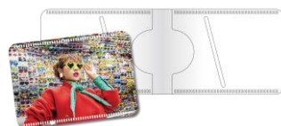
Aセットオリジナルパスケース (Web限定)