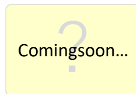
3月/押上〈スカイツリー前〉