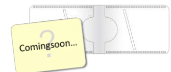
Bセットオリジナルパスケース (Web限定)