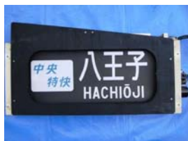
行先表示器(イメージ)