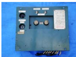
行先指令器(イメージ)