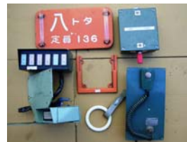
鉄道部品(イメージ)

* 鉄道部品の商品点数は、34 種類 134 点（使用済品）を販売する予定です（オークション対象 7 種類 13 点、オークション対象外 27 種類 121 点）。なお、中央線 201 系の未使用の鉄道部品も、13 種類 146 点を販売する予定です。