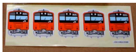
中央線 201 系シール(イメージ)100 円