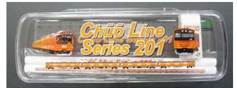
中央線201系文具セット(イメージ)