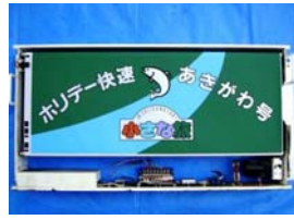
前面種別表示器(イメージ)