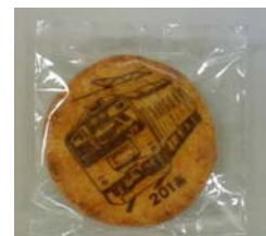
中央線 201 系草加せんべい (イメージ) 500 円(5 枚 1 セット)