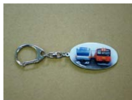
中央線 201 系/E233 系 キーホルダー(イメージ)600 円