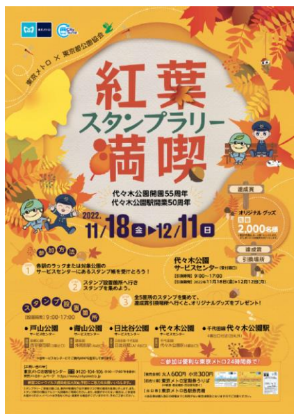
告知ポスター(イメージ)