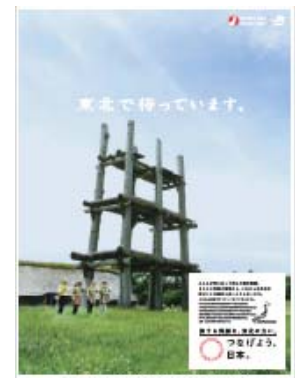
イメージ(三内丸山遺跡)