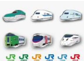
ピンバッジセット(イメージ)

モバイルラリー告知B1ポスターをJR各社の主な駅で掲出いたします。掲出時期は2011年7月28日(木)以降を予定しております。