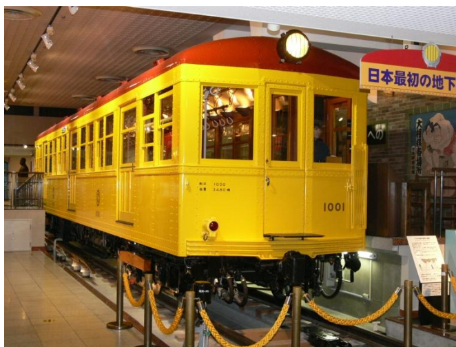
日本初の地下鉄車両 1000 形（近代化産業遺産）