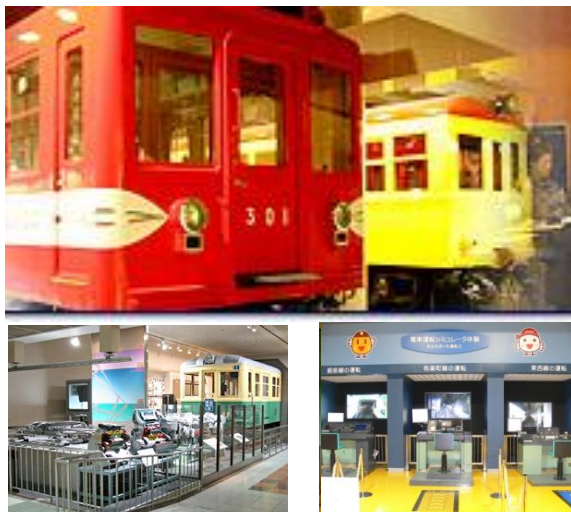
上：懐かしの車両の共演（左：300形 右：1000形）