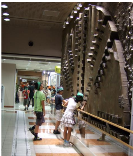
副都心線建設工事で使用したシールドマシン・カッターディスク（直径約6.7m）

また、近代化産業遺産に認定された日本初の地下鉄車両の展示や、4種類の運転シミュレーターなど、大人からお子さままで、楽しみながら地下鉄に関する知識と理解を深めることができます。