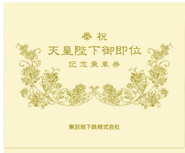
「専用封筒」のイメージ