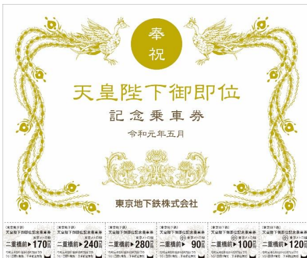
「天皇陛下御即位記念乗車券」のイメージ