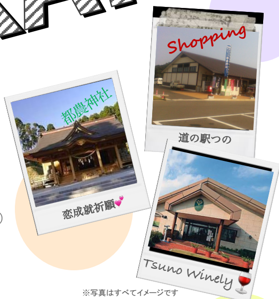
※写真はすべてイメージです