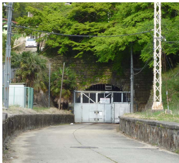
現在の旧生駒トンネル大阪側