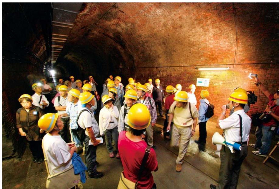
昨年のツアーの様子(トンネル内部は真夏でも17℃ほどです)