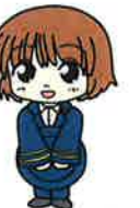
上毛電鉄友の会 マスコットキャラクター 赤城いずみ