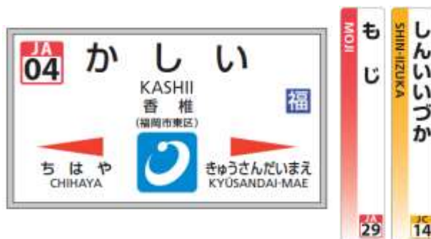
（駅名標への表示イメージ）