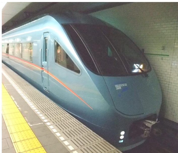
特急ロマンスカー 「メトロニューイヤー号」