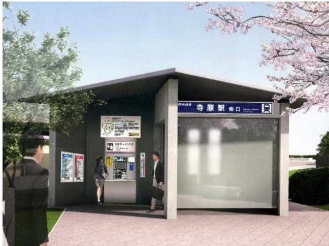
寺原駅南口イメージ図