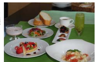
プレミアムフルーツランチ (イメージ)