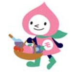
JRの山梨キャラクター 「ももずきん」

JR東日本では、「フルーツ王国山梨」として、7月～8月のもも狩りをテーマにしたびゅう旅行商品を発売します。今年は、お好みの旅を作ることができる見晴し園コースを新規に設定しました。また、“本当に伝えたい「山梨」の魅力”〈山梨プレミアム〉と題したこだわりの旅も継続して設定しています。趣向を凝らした多数のコースをご用意しておりますので、ぜひ、ファミリー、グループ、カップルでももの甘い旬の味覚を心ゆくまでお楽しみください。