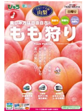
パンフレットの表紙(イメージ)