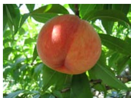
金桜園・もも (イメージ)