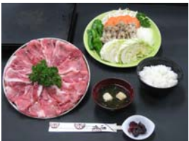
溶岩豚バーベキュー (イメージ)