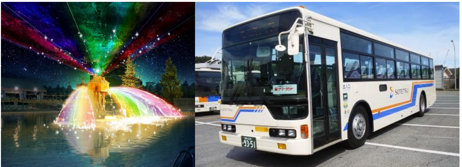
「絶景！ナイトプール」（左・イメージ）と東京サマーランド行きの相鉄バス（右・イメージ）